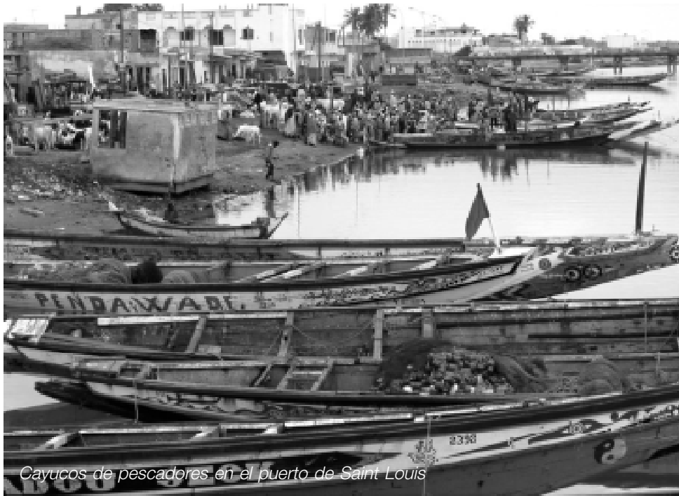
Cayucos de pescadores en el puerto de Saint Louis

inmigración pasa por la efectividad de la repatriación". El Gobierno Zapatero llegó a un acuerdo con el Gobierno de Senegal, que mandó un equipo policial para el reconocimiento de los inmigrantes. Un total de 2.027 han sido repatriados hasta el 7 de octubre, y quedan casi cuatro mil senegaleses hacinados en los centros de internamiento de Canarias.