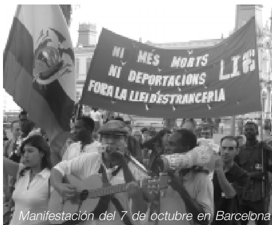
Manifestación del 7 de octubre en Barcelona

La única respuesta de los gobiernos europeos a la crisis de los cayucos ha sido la mano dura. En la cumbre de los ocho países mediterráneos de la UE, organizada en Madrid, se acordó proponer la creación de una Red europea de patrullas costeras, con sistemas electrónicos de vigilancia al estilo de los que EE.UU. emplea en la frontera mexicana, en colaboración con los ejércitos de los países de origen, aunque pertenezcan a regímenes sin garantías democráticas. La segunda propuesta que centró la cumbre fue la "prohibición de las regularizaciones masivas", siguiendo el discurso del ministro del interior francés Sarkozy, que defendió que "la credibilidad de las leyes de