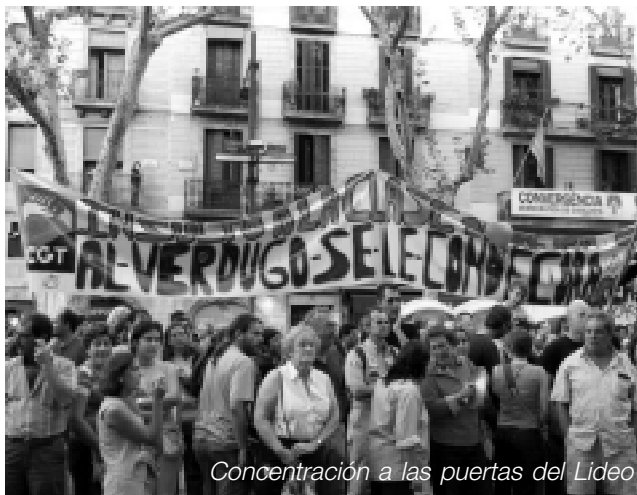
Concentración a las puertas del Liceo